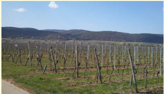
Am Bergweg, Weinlage Linsenbusch